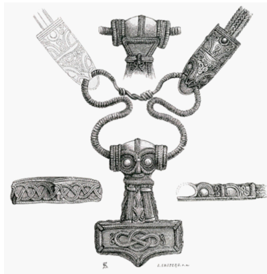
Figur 2. Ödesbög-thorshammeren som var fæstnet i dyrehoveder. Smykket var kun en lille del af et større skattefund. Skatten blev fundet i Östergötland i 1875.

Kæden er i alt 62 cm lang, og den vejer 67 g. Alene i ren guldpris udgør fundet altså en betragtelig værdi (mere end kr. 14.000 i råstofværdi med nutidens svingende guldpriser). Selve kæden er lavet som en slags flet af guldtråde, men det flotteste er de to dyrehoveder, som ses i enderne af kæden. Disse er lavet over en støbning, som har udgjort en base for det efterfølgende detaljerige arbejde. På basen har kunstneren virkelig udfoldet sine evner, for med talrige små guld-kugler og guldtråde har han udført alle hovedernes detaljer. Teknikkerne kaldes hhv. granulering og filigranarbejde. På denne måde er der lavet øjne, ører, næse og mund. I dyrehovedernes vidtåbne gab har der siddet øskner, hvoraf det ene dog er knækket af. Øsknerne har med sikkerhed båret et smykke af stor værdi, og det har med stor sandsynlighed været et smykke med en religiøs betydning. På et lignende svensk fund dateret til 900-tallet ses eksempelvis en meget flot udført og forgyldt Thors hammer i en kæde af denne art (figur 2), mens der i en række nyere bornholmske detektorfund er fundet eksempler med byzantinske relikviekors - det bedste kendte af de tydeligt kristent ladede smykker er dog Orøkorset, som bæres af to dragehoveder (figur 3). På trods af ændringen i det skildrede religiøse tilhørsforhold, lader det til at disse fornemt udførte kæder næsten altid præsenterede brugerens tro.