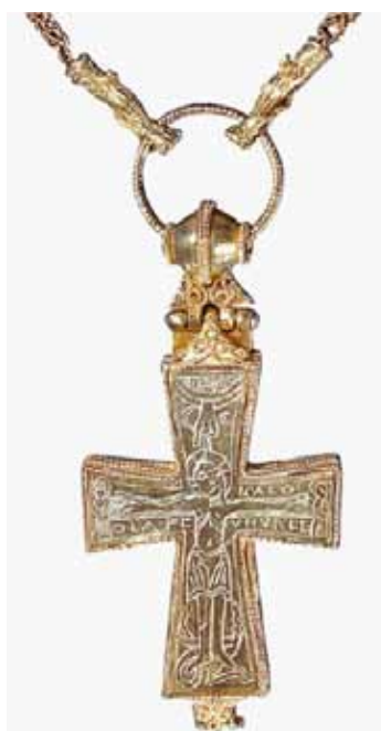
Figur 3. Orøkorset som blev fundet i 1849 på Orø. Det er lavet i guld og er dateret til den sidste halvdel af 1000-tallet. Typen er ca. 100 år yngre end Fæstedkæden, hvilken ses på den stilart dyrehovederne er lavet i. De er nemlig udført i den såkaldte Urnestil.