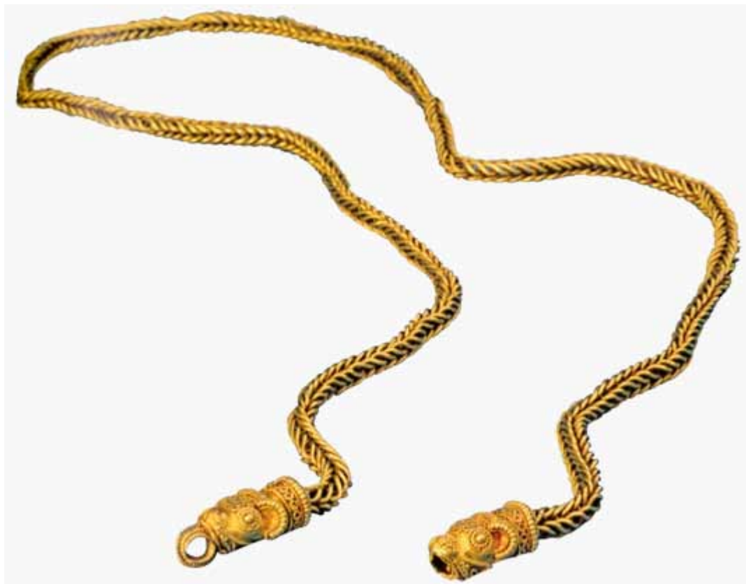
Figur 1. Guldkæden fra Fæsted. Fundet i 1911, hvorefter den blev erklæret som Danefæ. Kæden er uden sammenligning det flotteste fund fra vikingetiden i Vejen Kommune. Kæden dateres ud fra sin stil, som kaldes Jellingestilen, til 900-tallets midte.