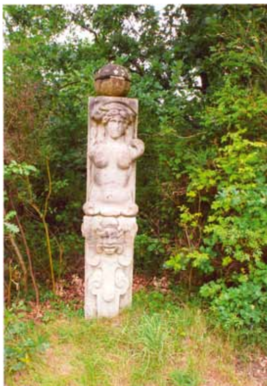
Sandstensskulpturerne ved indkørslen til villaen.

de nedtagne sandstensfigurer fragtet med jernbanen til Holsted og derpå med hestevogn videre til Baldersbæk. Sandstensskulpturerne havde på det tidspunkt, de blev nedtaget, siddet på Børsbygningen i ca. 300 år, og Københavns befolkning havde set på dem dagligt. Men da de kom til Jylland og blev rejst, blev befolkningen chokeret over, at "disse blasfemiske københavnere" kunne finde på at opstille figurer af nøgne kvinder.