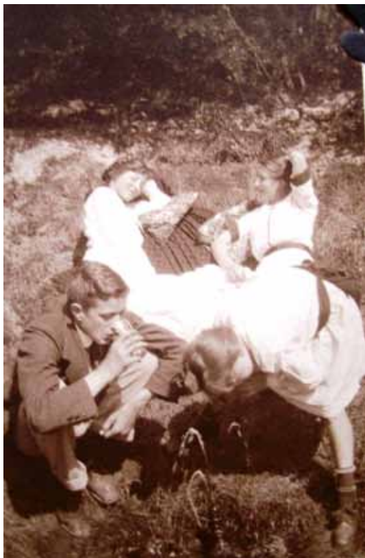
Kilden i 1916.

græstørv i terrasser, således at man sad behageligt på de medbragte puder og tæpper. Samme år skriver Bundgård i gæstebogen: "Kilden bragt til at springe og pyntet med grønt" I de efterfølgende år blev kilden et yndet udflugtssted, hvor man på varme sommerdage kunne nyde lyden af den rislende kilde og smagen af det friske vand. Ofte tog man på "udflugt" fra villaen til kilden, hvor stuepigerne serverede eftermiddagsteen.