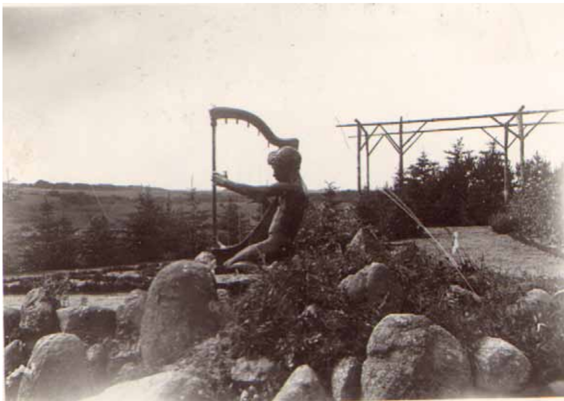
Den harpespillende pige i 1913 - med parterreanlægget og pergola i baggrunden.