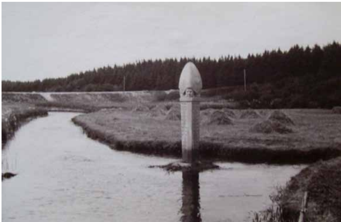
Den berømte treherredssten. I 1913 rejst i engen, hvor høet står i bæes.