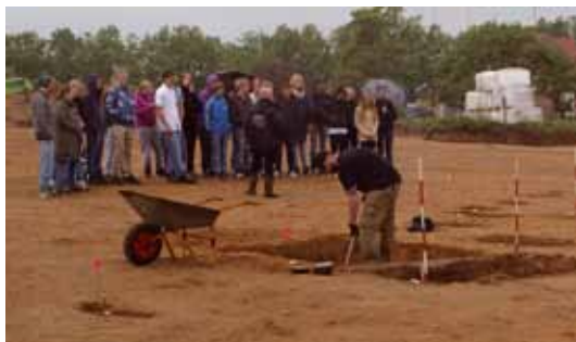
Omvisning på Rødding Nord.

Industri Vest, Brørup, HBV j. nr. 1420, forundersøgelse: 6 kogestensgruber, 1 affaldsgrube samt 3 stolpehuller, som dannede en tæt koncentration.