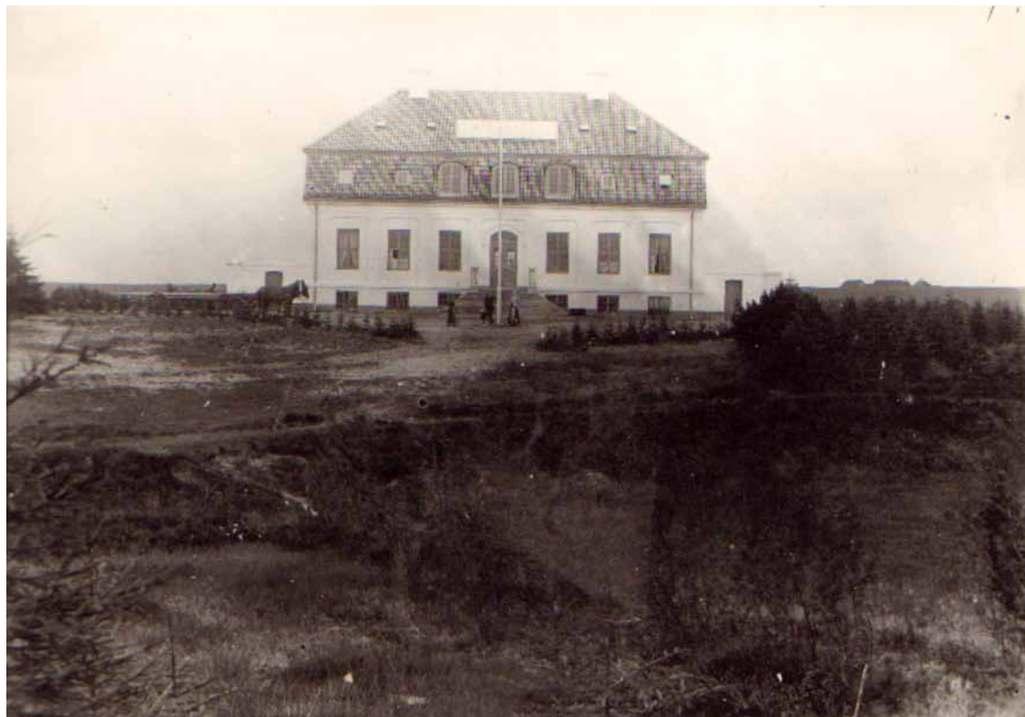
Villa Baldersbæk i 1913. Der er endnu ikke anlagt park, ligesom søerne ikke er gravet.