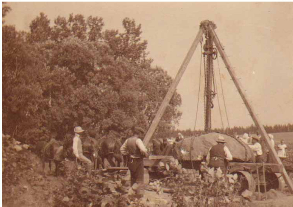
Bønderne i gang med at rejse den store stendysse i 1916.