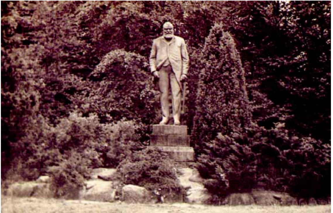
Statuen af Holger Petersen med den sirligt holdte beplantning omkring.

Afslutningsvis vil jeg gøre opmærksom på, at skoven er åben for offentligheden så alle har mulighed for at nyde de sjove